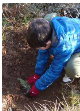
2 planter et tasser