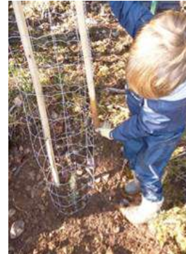
4 placer le grillage de protection