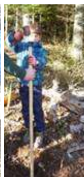
3 enfoncer les piquets