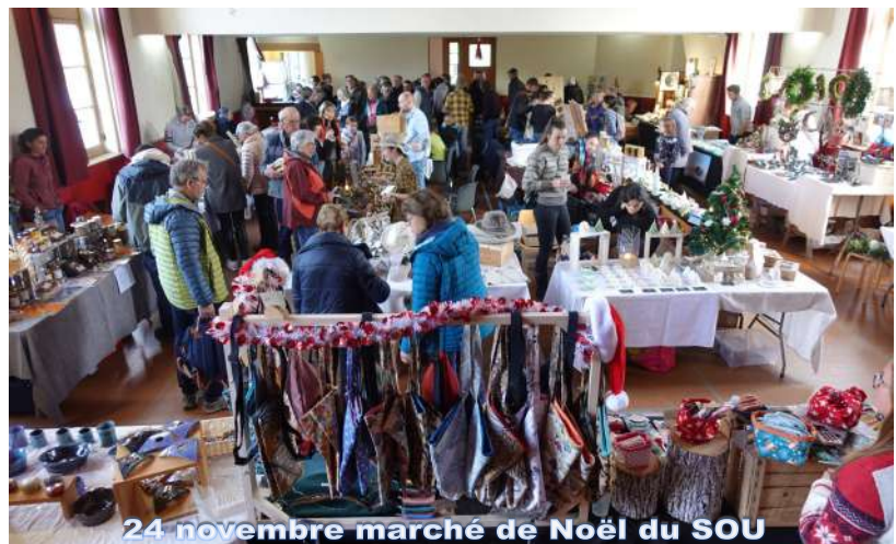
24 novembre marché de Noël du SOU