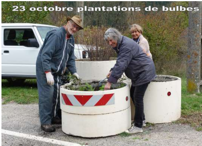
23 octobre plantations de bulbes