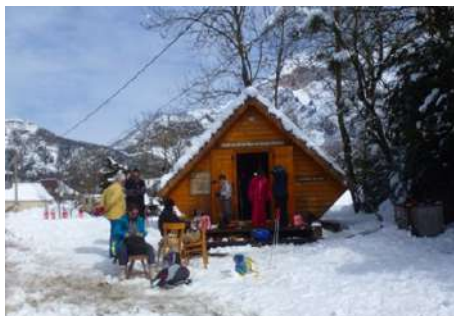
Sortie scolaire raquettes/ski février 2014