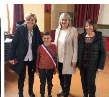
Vœux de la municipalité

Mairie de Tréminis --- L'Église — 38710 TREMINIS — Tel/ fax : 04 76 34 73 39 — Courriel : mairietreminis@orange.fr / site : treminis.fr Édité et imprimé par la Mairie de Tréminis — Tiré à 150 exemplaires — Gratuit Directrice de la Publication: Mme Anne-Marie FITOUSSI — Directeur de la Rédaction : M Frédéric MELMOUX