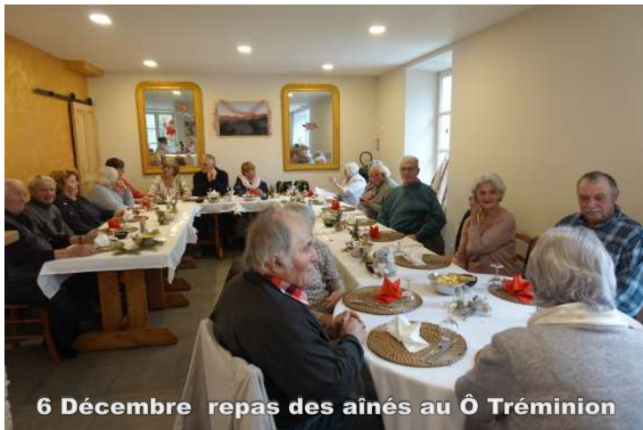
6 Décembre repas des aînés au Ô Tréminion