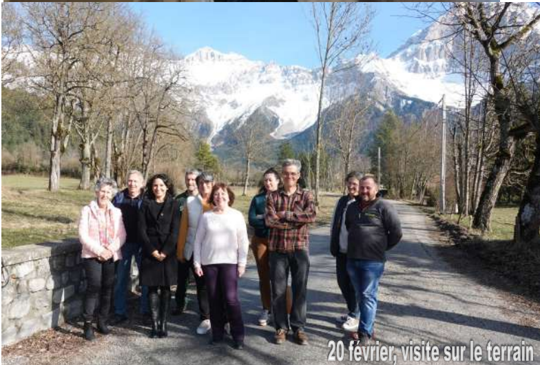
20 février, visite sur le terrain