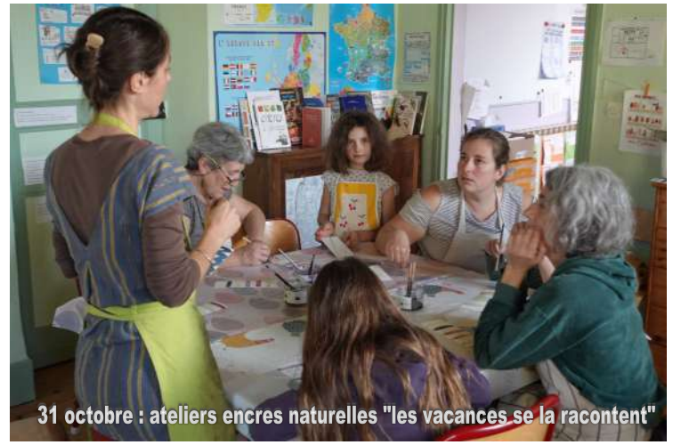
31 octobre : ateliers encres naturelles "les vacances se racontent"