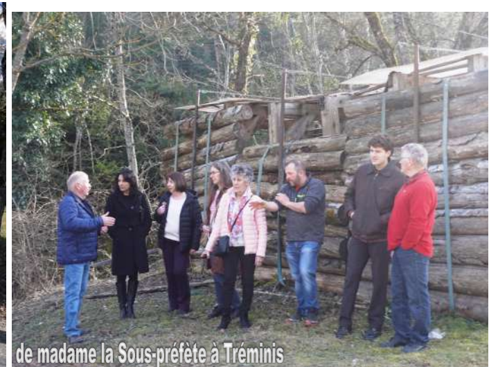
de madame la Sous-préfète à Tréminis