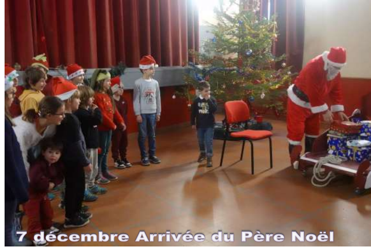
7 décembre Arrivée du Père Noël