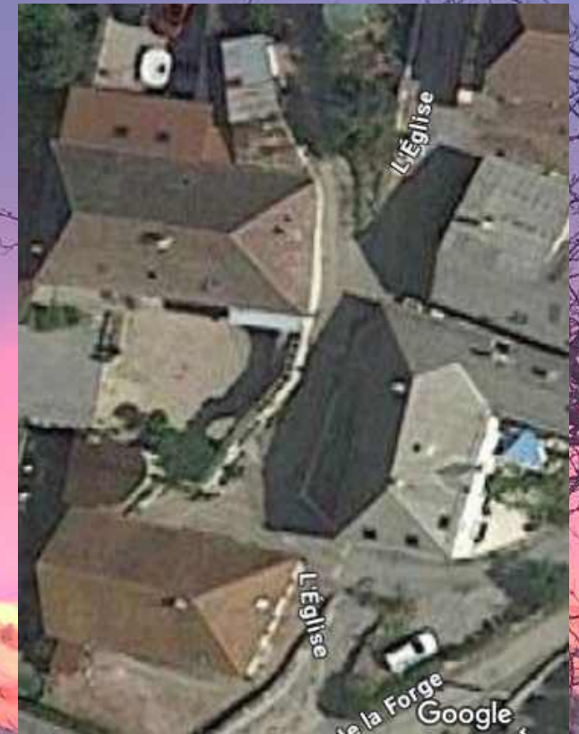
Voirie et réseaux eau pluviale Impasse de Maruard

Etude géotechnique - Pont des Granges et pont de la scierie – dans le courant du mois de janvier avant définition des travaux par le bureau d'études Louison Structures, appel d'offres, demandes de subvention et travaux.