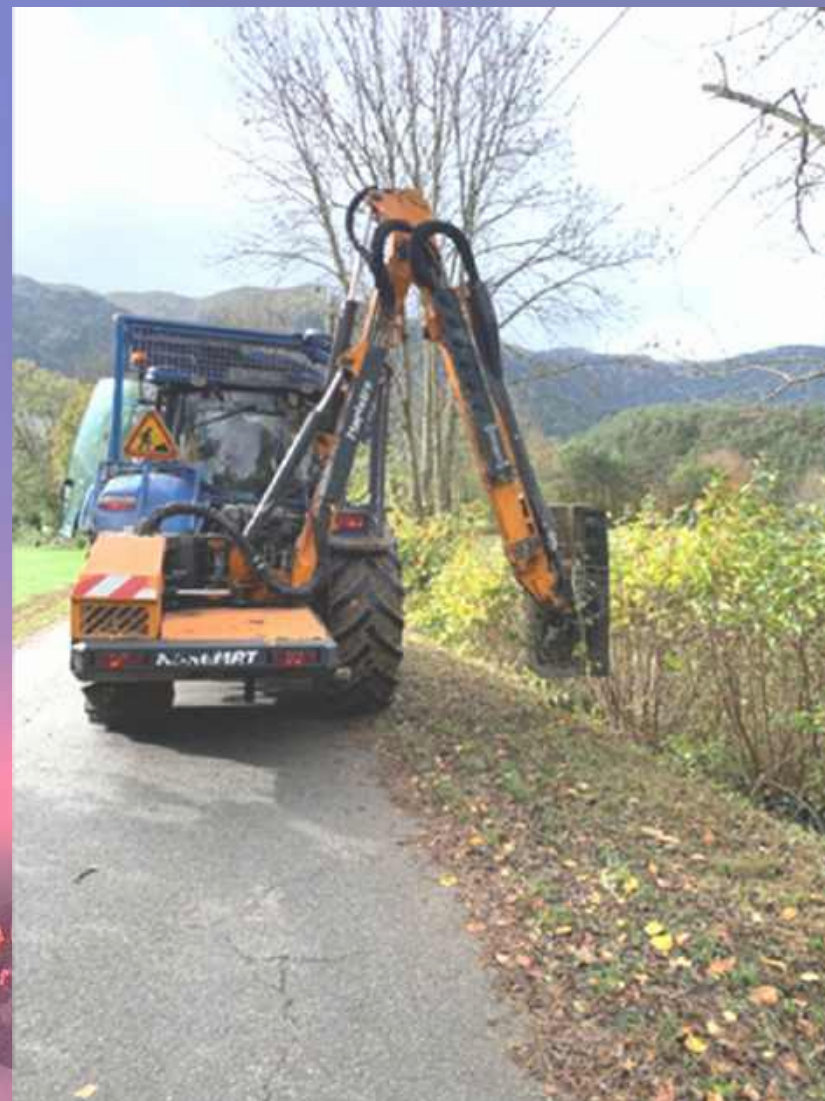
Elagage des plantations en bordure du chemin de la Chaux et de la route de la Sagne à Château-Bas