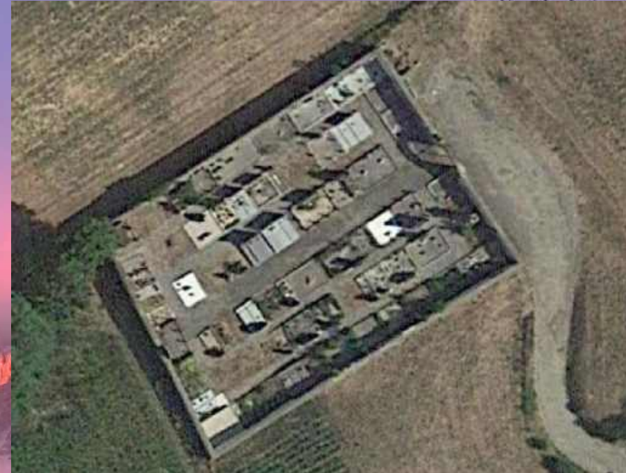
Agrandissement du cimetière

Projet de construction d'un bâtiment à vocation de local technique et à toiture photo voltaïque à l'entrée du village encore cours de réflexion avec un bâtiment plus petit.