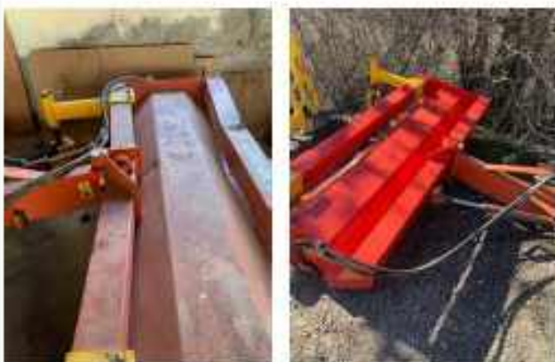
Réparation de la balayeuse endommagée en 2019...