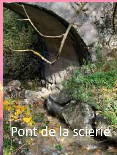
Pont de la scierie

Etude géotechnique - Pont des Granges et pont de la scierie – dans le courant du mois de janvier avant définition des travaux par le bureau d'études Louison Structures, appel d'offres, demandes de subvention et travaux.