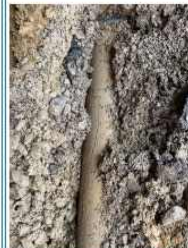
Réparation fuite d'eau sur canalisation d'adduction du réservoir