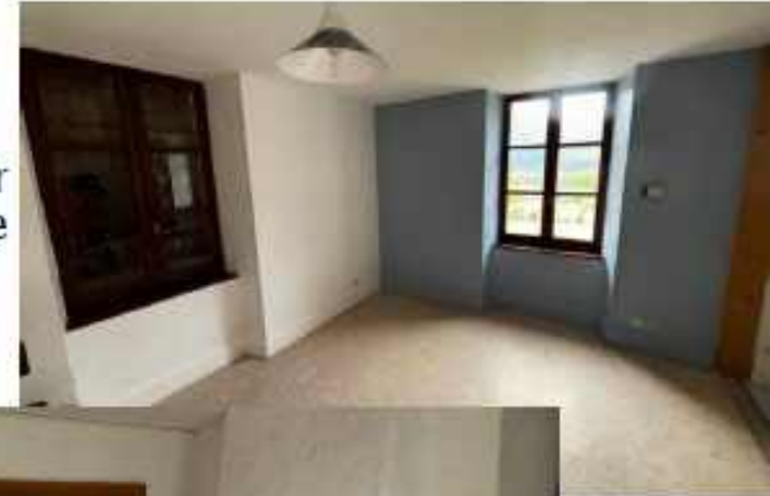
25 avril Chantier peinture de la cantine terminé