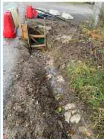
Réparation et changement de buse d'écoulement d'eau pluviale à Château-Bas