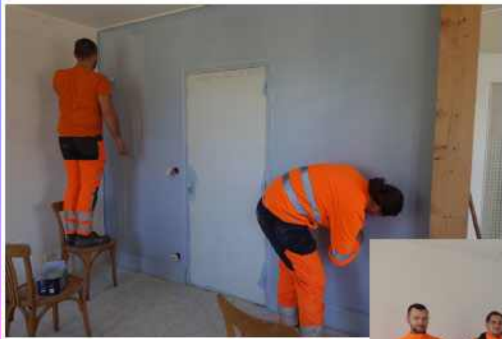
Travaux de rénovation salle de la cantine : rebouchage, plâtrage, sablage, lissage, puis peinture...