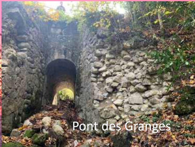
Pont des Granges

2 ème phase des remplacements des réseaux d'eau potable à Château Bas et à Château méa (suppression du citerneau)