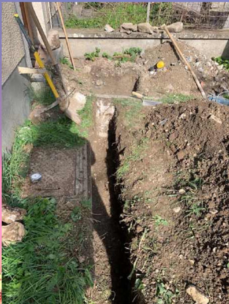
Remplacement de la conduite d'écoulement de cuisine du logement de l'ancienne école de Château-Bas.