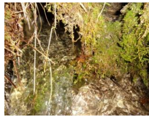
Sortie TP à protéger